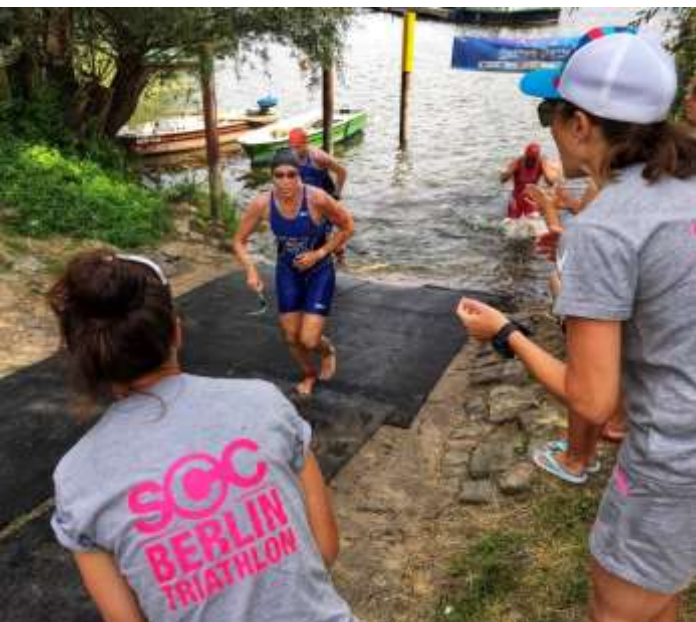
Triathlon bestreitet man auch im Team, ob auf oder neben der Strecke!

Der 1. Wettkampf am 18./19. Juni ist der Powertriathlon in Gera. Dies ist ein zweigeteiltes Rennen. Am Samstag findet zunächst ein Swim&Run statt. Geschwommen wird in einem 50m Hallenbecken. Beim Laufen geht es auf einen Berg hinauf und wieder hinab. Am Sonntag folgt mit einem Jagdstart (Abstände vom Vortag) ein Supersprinttriathlon. Der 2. Wettkampf am 2. Juli findet am Werbellinsee über die Olympische Distanz, bzw. für die Frauen über Sprint Distanz statt.