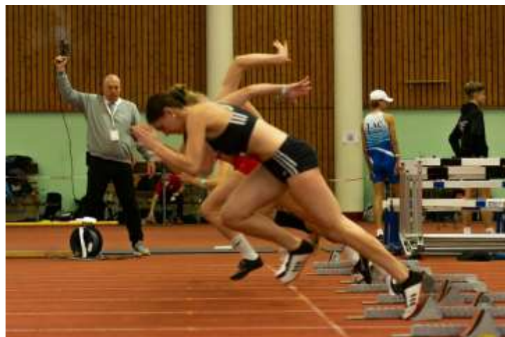
30m-Start beim Run&Jump

Statzkowski befand, konnte die Veranstaltung erfolgreich durchgeführt werden. Die Vereine bedankten sich wiederholt für die Schaffung der Wettkampfmöglichkeit trotz der anhaltenden Pandemie.