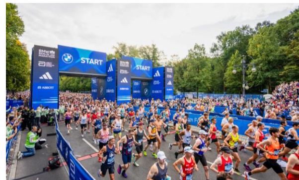
Berlin-Marathon 2025

In diesem Jahr stellte Sawe beim London Marathon mit 1:59:30 Stunden einen neuen Weltrekord auf. Nie zuvor war ein Mensch in eine m offiziellen Wettkampf über 42,195 Kilometer unter zwei Stunden gelaufen. >> ausführlicher Pressebericht