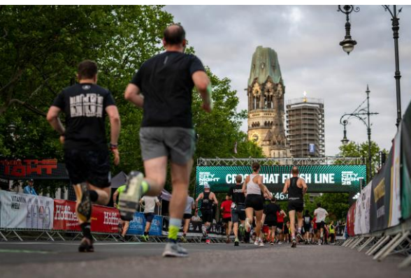
adidas Runners City Night 2025